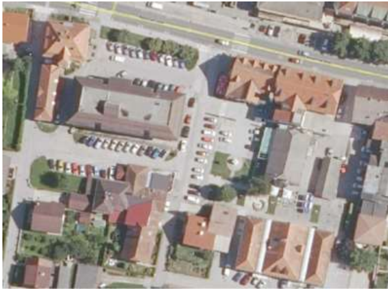
Slika: Mikrolokacija investicije