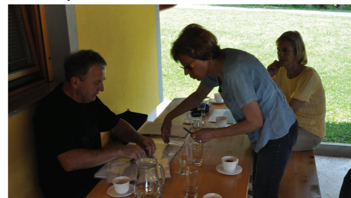
Preučevanje zbranih dokumentov

V soboto, 22. 6. 2013, je pot člane krožka vodila od dvorca v Radljah do cerkve sv. Pankracija. Seznanili so se z zgodovinskimi dejstvi, ki so vplivali na določitev meje, ki je prvotno potekala skozi cerkev. V nadaljevanju bodo raziskali dejstva, ki sodopriinesla, da je slovenska vasica sv. Lovrenc, ki je spadala pod župnijo Marenberg, po razpadu avstroogrške bila dodeljena Avstriji. Dokumentarno bodo raziskani in predstavljeni kulturni spomeniki Radelj ob Dravi, uničeni po 2. Svetovni vojni.